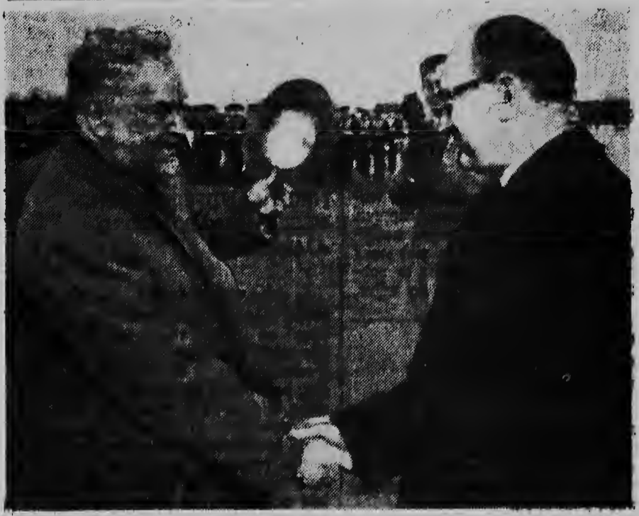
De Franse Premier Guy Mollet heeft onlangs een bezoek gebracht aan Moskou. Hierboven wordt hij (rechts) hartelijk begroet door Maarschalk Boelganin bij zijn aankomst op het vliegveld van Moskou. Mollet heeft besprekingen gevoerd over de handels- en culturele uitwisselingsmogelijkheden tussen Frankrijk en de Sovjet Unie.

Aan de grens van Elten, Wyler Sanderwick, Tuedderen en Aken-Bildchen zal voortaan de vlag van de Duitse hondrepubliek niet geplaatst worden ten teken, dat Duitsland de grens op die plaatsen niet erkent, zo is door de douane te Emmerich verklaard. Op alle andere Duitse grensplaatsen zal de Duitse vlag wel vertoond worden, aldus is door het ministerie van financiën te Bonn verordend.